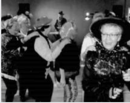
Im Karneval ging es auch bei den Senioren rund.