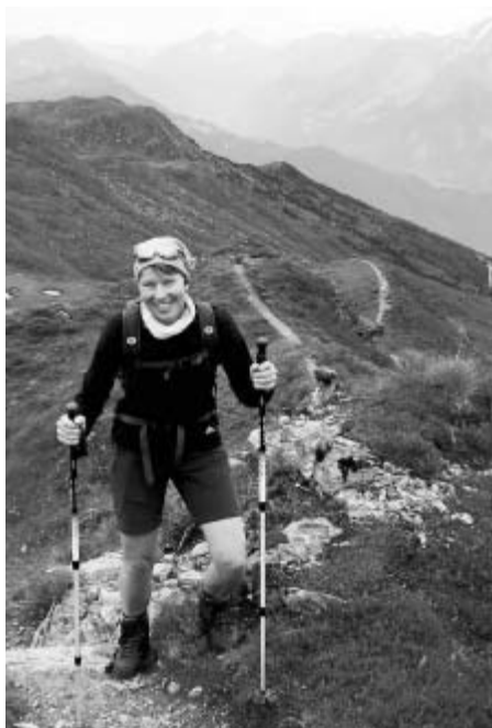
Zu Fuß über die Alpen ...

Gegen 22.00 Uhr knipst sie das Licht in ihrem Büro aus. Hinter ihr liegt die erste Sitzung der Gemeindevertretung in diesem Jahr. Der Haushalt 2017 ist endlich unter Dach und Fach. Bei der Entscheidung über die Anhebung der Gewerbesteuer hat sie eine Niederlage einstecken müssen. Sie hat vehement dagegen argumentiert. Vergeblich. Nachdem die Gemeindevertreter gegangen sind, braucht sie noch diese eine Stunde in ihrem Büro, um abzuschalten, sich zu sammeln und den neuen Tag vorzubereiten.