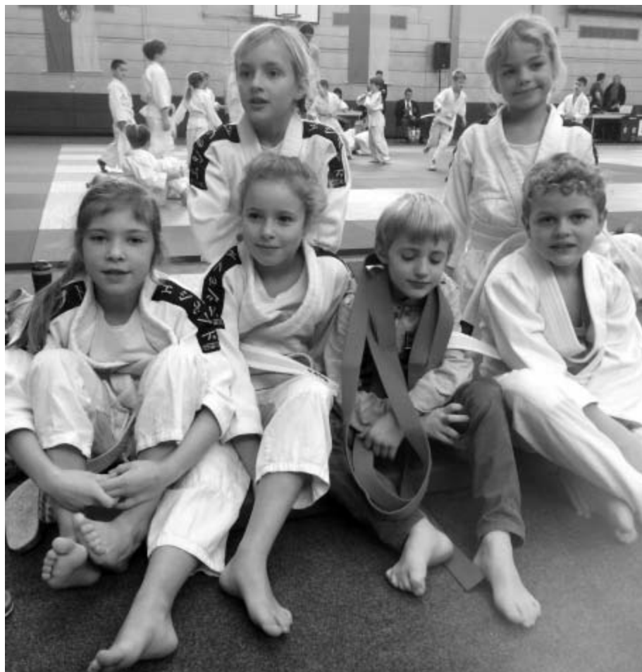
Der Judo-Nachwuchs der SG Geltow auf Erfolgskurs.

Der Vorstand gratuliert zu diesem erfreulichen Ergebnis und wünscht den Keglern weiterhin viel Erfolg.