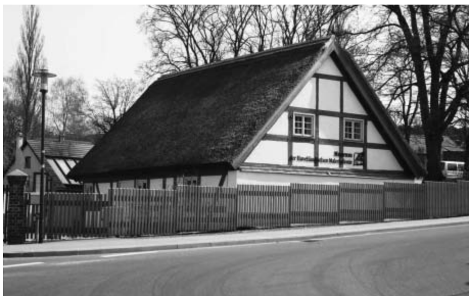
Das malerische Museum in Ferch.

In diesem Jahr gibt es in unserer Gemeinde wahrlich viel zu feiern. Eine Vielzahl von Veranstaltungen der Gemeinde, der Vereine und Institutionen in den Orten laden die Schwielowseer und ihre Gäste ein, die Vielfalt unserer gesamten Gemeinde zu entdecken.