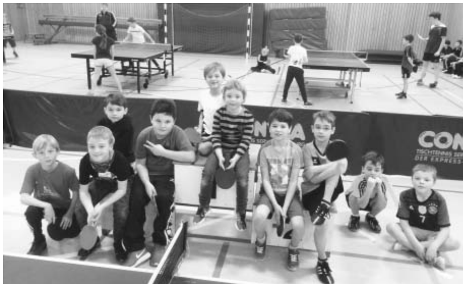
Viel Erfolg für die Jüngsten.

Aber nicht nur Kinder werden an den grünen TT-Tischen gesichtet, sondern auch Eltern, die auf den harten Holzbänken nicht mehr zu halten sind. Kaum wird während des Turniers ein Tisch frei, wird dieser im Nu von spielbegeisterten Erwachsenen okkupiert. Außerdem kann