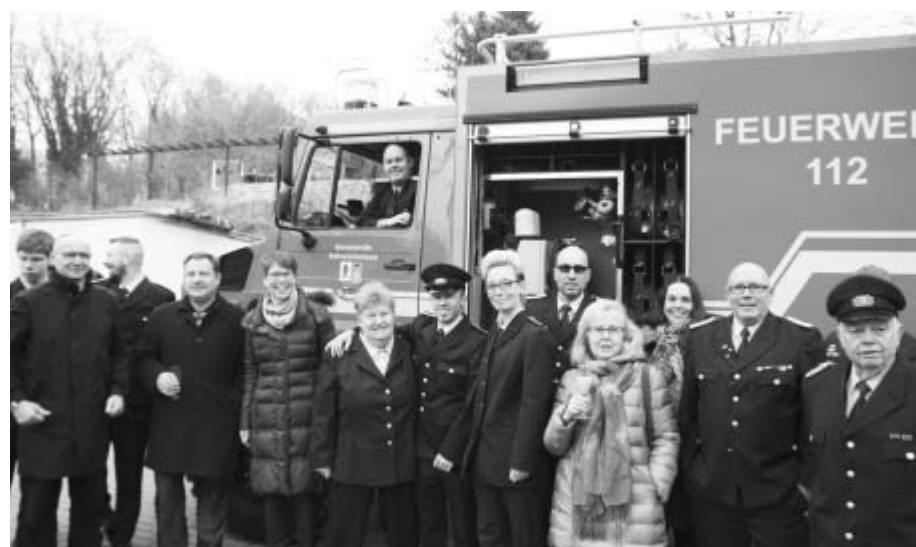
Viel politische Prominenz feierte mit der Feuerwehr Ferch die Übernahme des neuen Tanklöschfahrzeugs.